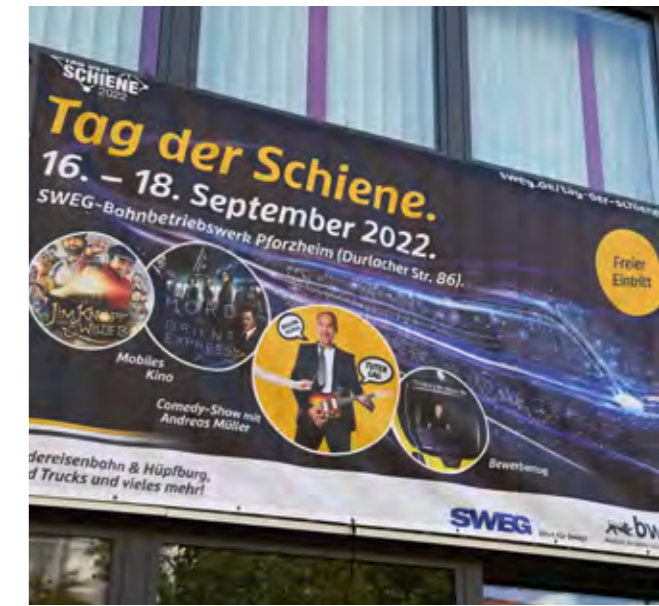
Transparent auf dem Gelände der Bahnbetriebswerkstatt der SWEG Bahn Stuttgart GmbH in Pforzheim

Marionettentheater Jim Knopf und Lukas, der Lokomotivführer, die Stars. Der „Tag der Schiene“ ist vom Verein Allianz pro Schiene 2022 ins Leben gerufen worden. Er soll die Stärken des Zugverkehrs sichtbar machen. Der nächste Termin steht bereits fest: 15. bis 17. September 2023.