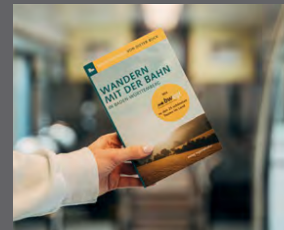
Im Buchhandel erhältlich: Der Wanderführer von Dieter Buck

Dieter Buck: Wandern mit der Bahn in Baden-Württemberg. Ubstadt-Weiher, Verlag Regionalkultur 2021, 19,99 Euro