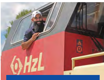
Erfolg: Flüchtling wird Lokführer