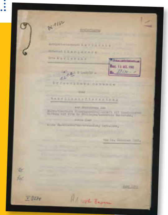
Der Gesellschaftsvertrag zur Errichtung der Südwestdeutschen Eisenbahn-GmbH mit Sitz in Ettlingen vom 10. Dezember 1962. Das Original befindet sich im Hauptstaatsarchiv Stuttgart