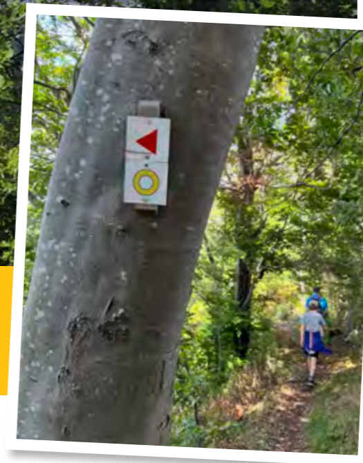
Ein Teil der hier vorgestellten Wanderung verläuft auf dem bekannten Albsteig (HW 1) – zu erkennen an der Markierung mit dem roten Dreieck

Spektakuläre Ausblicke und ein versteckter Wasserfall sind nur zwei Gründe, die diese Tour um Jungingen zu einem Genuss machen