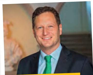
GEORG FRIEDRICH PRINZ VON PREUSSEN, OBERHAUPT DES HAUSES HOHENZOLLERN

Gratulanten dürfen zu einem Fest nicht fehlen. Lesen Sie hier, was Prominente der SWEG wünschen