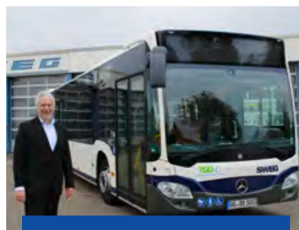
Fahrschule: Für künftige Busfahrer