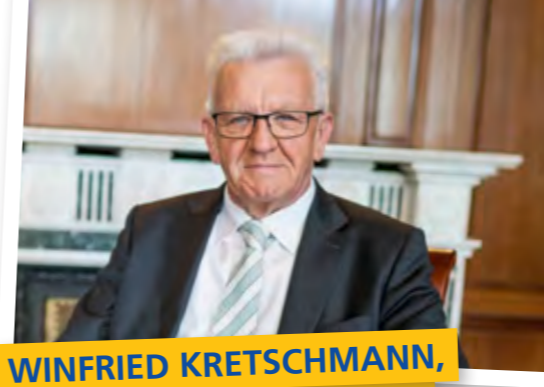
WINFRIED KRETSCHMANN, MINISTERPRÄSIDENT BADEN-WÜRTTEMBERG

Die Klimakrise macht die Verkehrswende dringender denn je. Die SWEG ist ein ganz wichtiger Partner, wenn es darum geht, die Klimaziele des Landes zu erreichen und unsere „ÖPNV-Strategie 2030“ umzusetzen. Zum 60. Geburtstag wünsche ich der SWEG, ihren Beschäftigten und ihren Fahrgästen allzeit gute Fahrt – in the Länd und auch darüber hinaus.