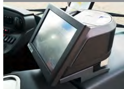
Dank moderner Bordrechner konnte das 9-Euro-Ticket auch in den SWEG-Bussen verkauft werden

Haben Sie auch eine Frage an die SWEG? Dann schreiben Sie eine E-Mail an info@sweg.de . Mit etwas Glück wird Ihre Frage in der nächsten Ausgabe an dieser Stelle beantwortet.