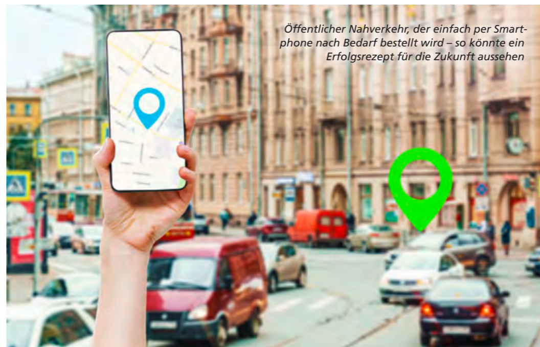
Öffentlicher Nahverkehr, der einfach per Smartphone nach Bedarf bestellt wird – so könnte ein Erfolgsrezept für die Zukunft aussehen