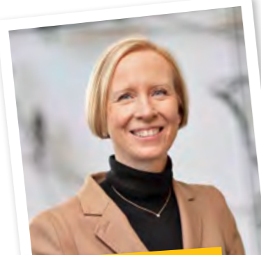
STEFANIE BÜRKLE, LANDRÄTIN LANDKREIS SIGMARINGEN

Zum 60-jährigen Bestehen des Unternehmens gratuliere ich sehr und wünsche für die Zukunft alles erdenklich Gute! Ein Blick in die Vergangenheit zeigt, dass es viele verbindende Elemente zu meinem Haus aber auch zur preußischen Geschichte gibt. So gehört zur SWEG die 1899 gegründete Hohenzollerische Landesbahn (HzL), deren Strecke auch an der Burg Hohenzollern, dem Stammsitz meiner Familie, vorbeiführt. Sowohl die Gründung der Bahn als auch der Wiederaufbau der Burg liegen nur ein paar Jahre auseinander. Beide Projekte gehen zurück auf eine Reihe von nachhaltigen und durchaus erfolgreichen preußischen Fördermaßnahmen im späteren 19. Jahrhundert. Die HzL besteht heute in der SWEG weiter und die Burg Hohenzollern vor allem durch die 350 000 Besucher, die jedes Jahr und zum großen Teil mit Hilfe der HzL-Züge den Weg zu uns finden. Dafür sage ich herzlichen Dank!